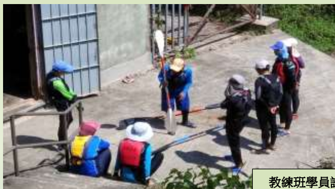
教練班學員試教中

五月底，獨木舟總會在石門舉辦分齡短途賽，以往本會參加人數寥寥可數，但今屆本小組將有 17 位健兒參加，雖然這賽事為主要為個人項目，並不設團體獎項。但本組組員一定互相鼓勵，發揮團隊精神！