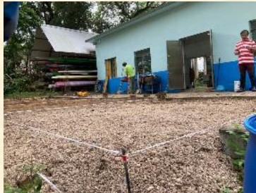
石仔泥沙英泥準備就緒