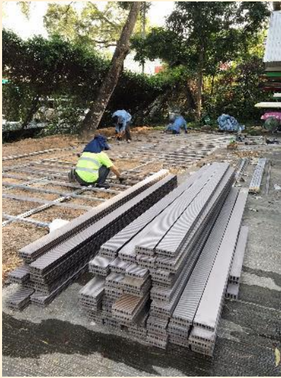
由王嘉池及其安排的技術人員 28/6 開始安裝