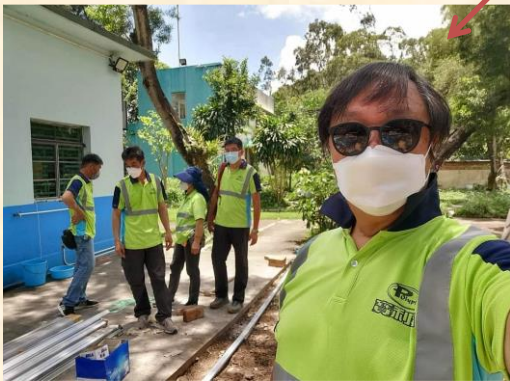
該仿木塑膠地台位於禮堂與球場之間 空地