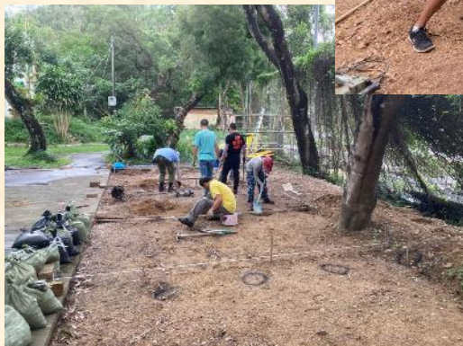
25 個石屎基座完成，方便下周後可以進行安裝工程。