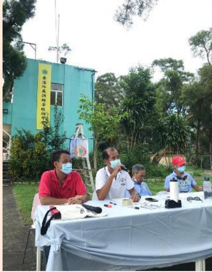
主席主持周年大會 Chairman presided over the annual general