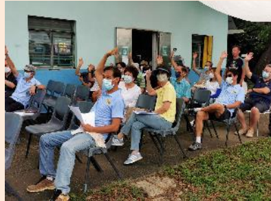
選舉 2022 /23 年度 執行委員會成員 Election of the 2022/23 Executive Committee